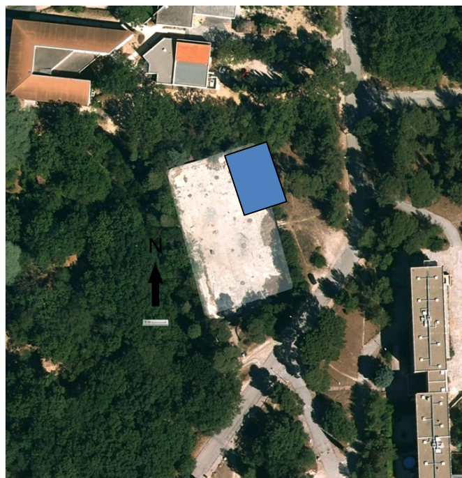
Figure 2 - Parcelle choisie sur le terrain

Le terrain que nous avait proposé le CROUS (plus de 2500m 2 ) s'est avéré trop grand pour signer une convention facilement. Aussi, ils nous proposent un terrain de 200M 2 sur ce même site et si nous leur prouvons que le projet est viable, nous obtiendrons la superficie initiale dans un an et ils nous aideront dans les démarches.